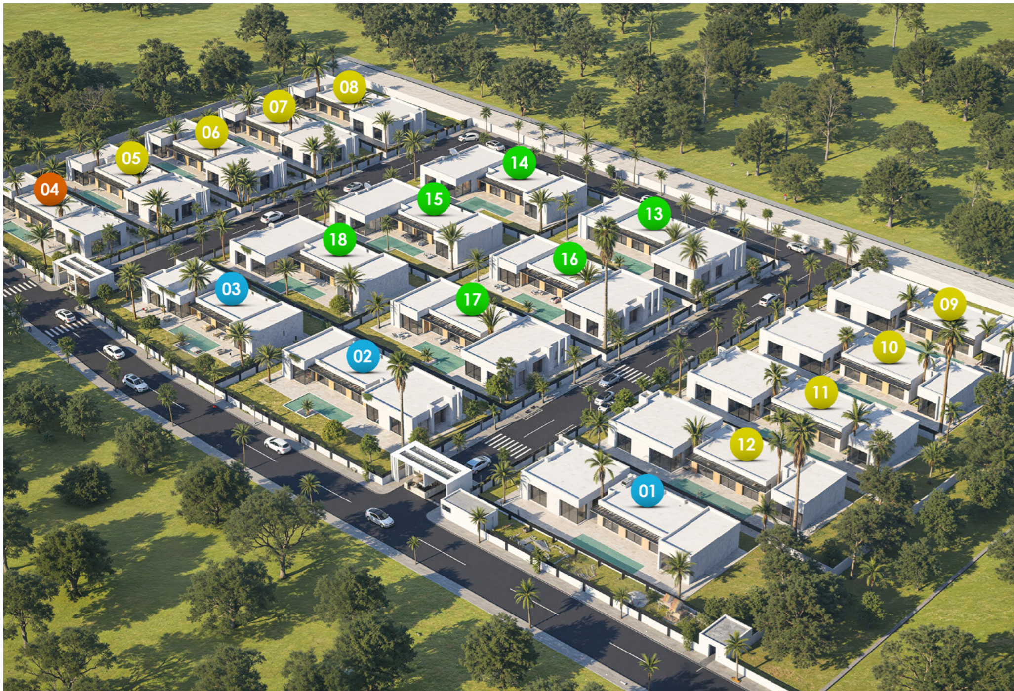
Tableau de contenance